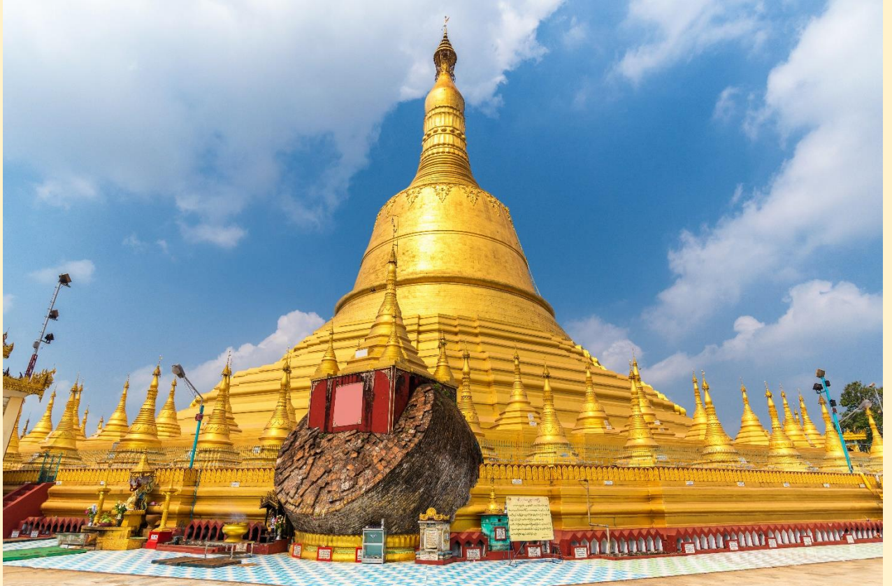
นำคณะเดินทางสู่ เมืองไจ้กั๊ทโย (Kyaikhtyo) ใช้เวลาเดินทางประมาณ 2-3 ชั่วโมง

จากนั้นนำท่านเดินทางสู่ เมืองหงสาวดี(BAGO) ซึ่งอยู่ห่างจากย่างกุ้งประมาณ 80 กม. (ใช้เวลาเดินทางประมาณ 1.30-2 ชั่วโมง) ผ่านชม สุสานสัมพันธมิตร ยุคสมัยพม่ารบกับญี่ปุ่นในสงครามโลกครั้งที่ 2 จากนั้น นำท่านนมัสการ เจดีย์ชเวมอดอว์ (ShwemawdawPagoda) คนไทยนิยมเรียกว่า พระมหาเจดีย์มูเตา ซึ่งเป็นเจดีย์ใหญ่คู่บ้านคู่เมืองที่สูงที่สุดของหงสาวดีและยังเป็นที่เคารพสักการะของชาวมอญและพม่ามาช้านาน แล้วนำท่านชม พระราชวังบุเรงนอง ซึ่งเพิ่งเริ่มขุดค้นและบูรณะปฏิสังขรณ์เมื่อปี 2533 จากซากปรักหักพังที่ยังหลงเหลืออยู่ทำให้สันนิษฐานได้ว่าโบราณสถานแห่งนี้เป็นพระราชวังของพระเจ้าหงสาวดีบุเรงนองปัจจุบัน